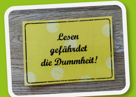
Illustration: Ulrike Wolters, Skowronski & Koch Verlag

Han, Byung-Chul: Vita contemplativa – oder von der Untätigkeit. Ullstein 2022