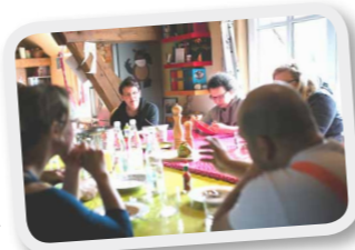
Vaußhof Tischge- meinschaft

Immer wieder sind da auch Praktikanten und FÖJler, beim Hoffest Menschen mit körperlichen und geistigen Behinderungen – und dann die SolaWi-Leute von der Solidarischen Landwirtschaft. Von denen hieß es am Stammtisch: „Jetzt haben sie es auch noch geschafft, andere für sich auf dem Feld arbeiten zu lassen.“