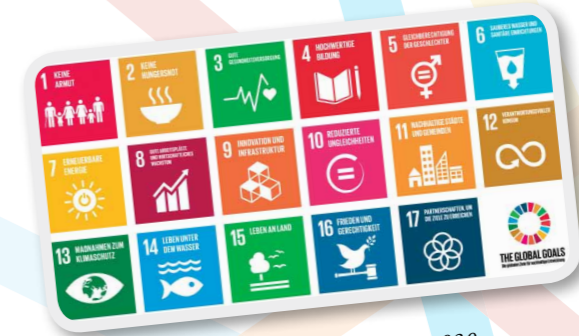
Die UN-Entwicklungsziele 2030