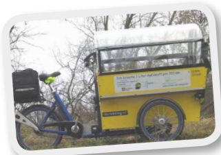
Vitopia Apfel- saft

Die Vitopia-Gemeinschaft nutzt möglichst umweltfreundliche Transportmöglichkeiten (Fahrrad, Bahn), ein E-Auto und möglichst wenig ein normales Auto.